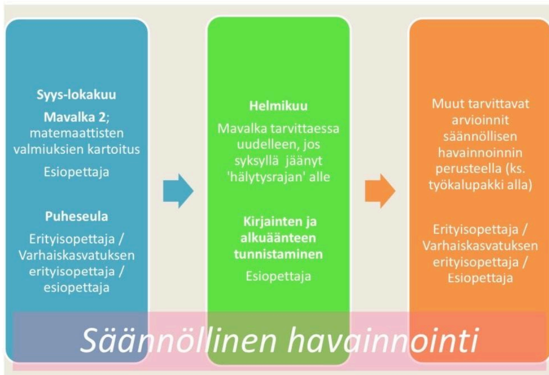
Esiopetusvuoden aikana tehtävät arvioinnit ja kartoitukset

siirtyvät Minusta tulee koululainen-lomakkeen liitteenä perusopetuksen opettajalle. Pedagogiset asiakirjat siirtyvät Wilmassa perusopetukseen. Esiopetusvuoden aikana tehtävät arvioinnit ja kartoitukset