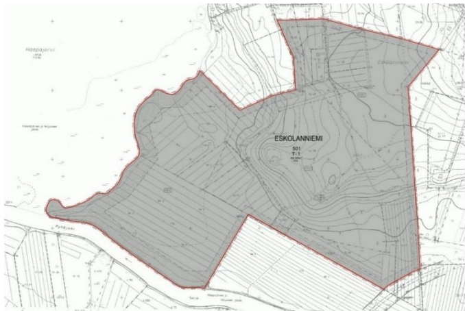
Voimassa oleva asemakaava.

Suunnittelualueella voimassa oleva Eskolanniemen rakennuskaava osalle Eskolanniemen aluetta koskien kortteliä 501 on hyväksytty 30.7.1987. Asemakaavassa kortteli 501 on teollisuus- ja varastorakennusten korttelialuetta (T-1). Alueelle saa rakentaa voimalaitoksia ja energian tuotantoon ja siirtoon liittyviä teollisuus-, varasto- ja huoltorakennuksia, rakennelmia ja laitteita ja voimalaitoksen huollon, korjauksen ja vartiointin kannalta tarpeellisia asuntoja sekä voimalaitoksen henkilökunnan virkistystoimintaan tarkoitettuja rakennuksia ja rakennelmia. Kortteliin rakennettavaksi sallittujen rakennusten yhteenlasketuksi enimmäistilavuudeksi kuutiometreinä on määritelty 300 000 m 3 . Kaavan mukaan rakentamiseen saa käyttää 20 % alueesta. Lisäksi kaavassa on määritelty rakennuksen ylimmän kohdan korkeusasema, jonka yli saa kohota piippuja ym teknisiä laitteita. Korttelin reuna-alueet on määrätty istutettaviksi tai luonnontilaisina säilytettäväksi alueiksi, joille saa rakentaa voimalaitoksen käytön, huollon ja vartiointin tarvitsemia rakenteita ja laitteita sekä muita liityntöjä.