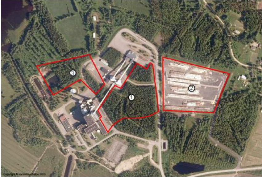
Uuden biojalostamon alustava aluevaraus olemassa olevalla voimalaitosalueella. 1-bioetanolilaitos, 2-biopolttoaineterminaali, 3-biokaasulaitos + jätevedenpuhdistamo (Lähde: Biojalostamon ympäristölupahakemus, 11.2.2019, Kanteleen Voima Oy)

Osoitettaessa maakunta-, yleis- tai asemakaavassa alueita suuronnettomuusvaarallisiksi luokitelluille tuotantolaitoksille tai varastoille käytetään merkintää T/kem ”teollisuus- ja varastorakennusten korttelialue, jolla on / jolle saa sijoittaa merkittävän, vaarallisia kemikaa- leja valmistavan tai varastoivan laitoksen”. Viranomaisten on varmistettava, että kaava mahdollistaa suunnitellun toiminnan. Kaavaprosessin aikana pyydetään Turvallisuus- ja kemikaalivirasto Tukesilta ja pelastusviranomaiselta lausunto.