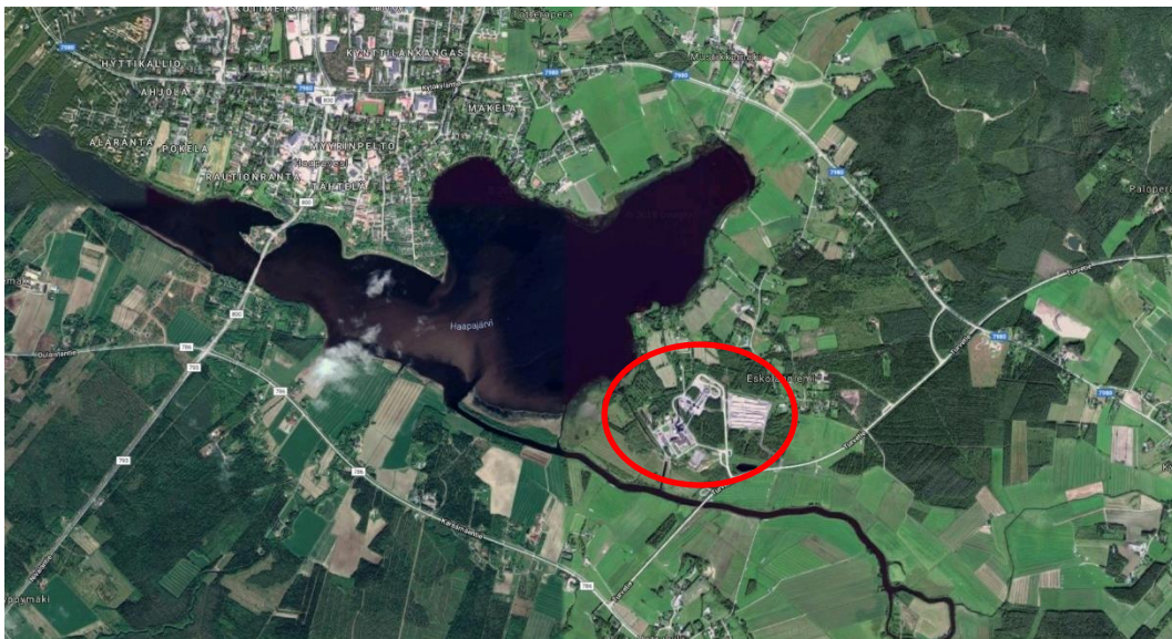
Suunnittelualueen sijainti.

Suunnittelualueella on entuudestaan teollista toimintaa. Eskolanniemessä Haapajärven ja Turvetien väliin rajautuvalla alueella sijaitsee Kanteleen Voima Oy:n omistama lauhdevoimalaitos. Voimalaitosaluetta ympäröivät viljelyskäytössä olevat peltoalueet sekä viljelyksestä poistuneet, metsittyneet vanhat peltoalueet. Myös suunnittelualueen keskellä voimalaitosrakennuksien ympärillä on pieniä metsäalueita. Suunnittelualueen pohjois- ja koillispuolilla Eskolanniementien ja Eskolantien varsilla on asutusta, Haapajärven rannalla suunnittelualueen pohjoispuolella on pienellä alueella loma-asutusta.