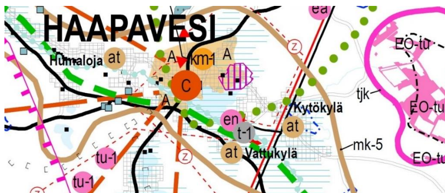
Ote maakuntakaavojen yhdistelmäkartasta (Pohjois-Pohjanmaan liitto, yhdistelmäkartta 5.11.2018).

Haapajärven ranta-alueet kuuluvat maakunnallisesti arvokkaaseen maisema-alueeseen Pyhäjokilaakson, Mustikkamäen ja Sulkakylän kulttuurimaisema. Voimalaitosalue ei kuulu maisema-alueeseen, mutta sijaitsee maisema-alueen lähituntumassa sen reunalla.