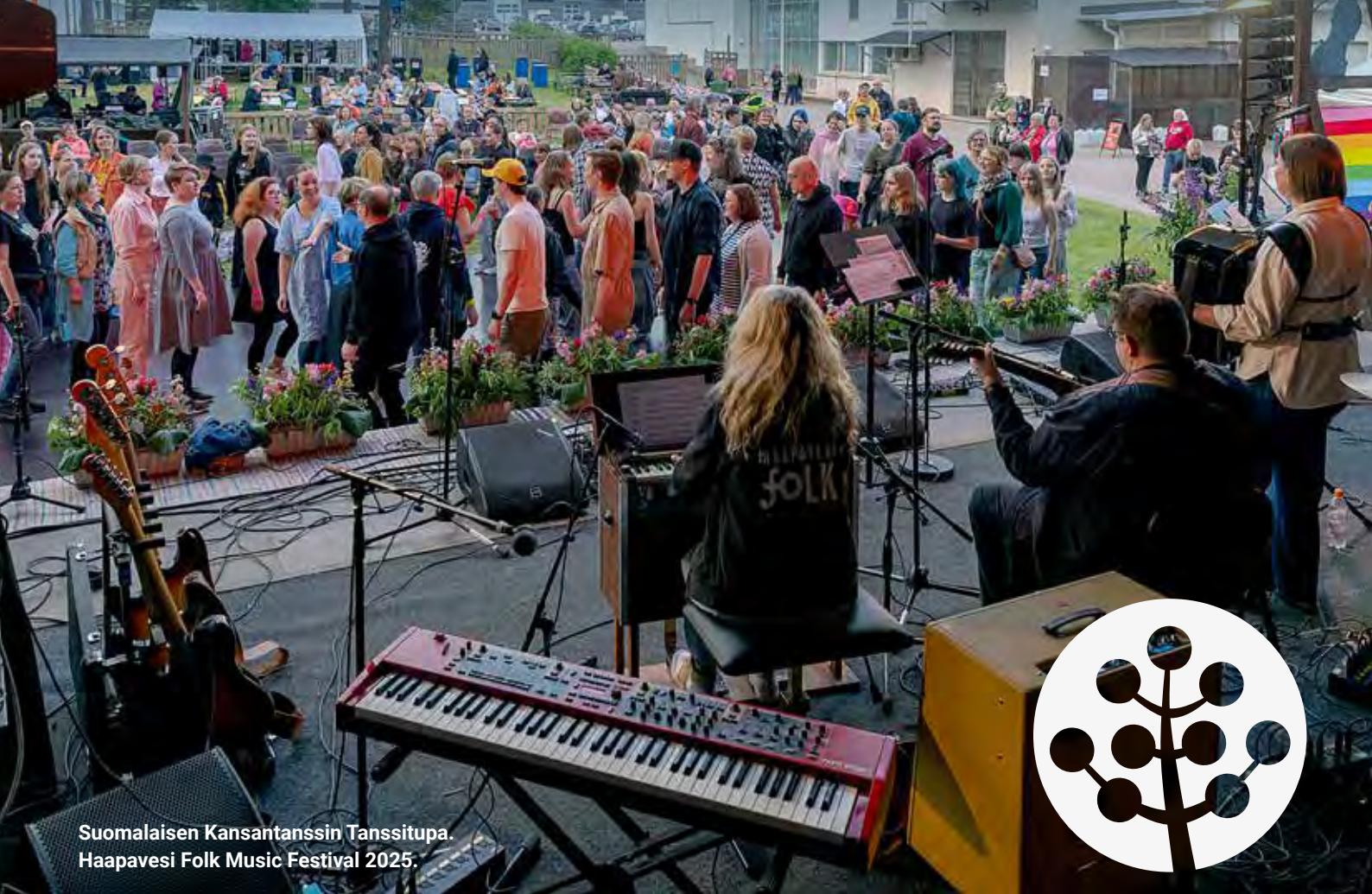
Suomalaisen Kansantanssin Tanssitupa. Haapavesi Folk Music Festival 2025.