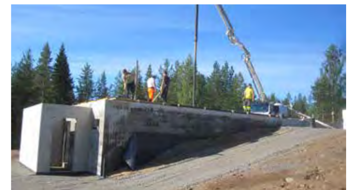
Aakonvuoriyhdistys ry:n ensimmäisenä hankkeena syntyi alueen keskipiste, Aakonmaja. Rakennustyöt etenivät pitkälti talkoovoimin ja eri toimijoiden yhteistyöllä.