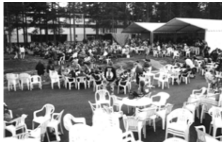
Folk-tunnelmaa 1990-luvun alkupuolelta.

kuuluu lämmin kiitos kaikille vuosikymmenien aikana mukana olleille.