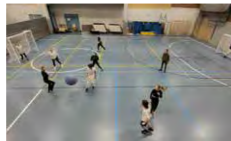
Lukion norsupalloturnaus. Kuvassa on 1. vuosiluokan ja opettajien joukkue vastassa 2. vuosiluokan oppilaat.

HAAPAVEDEN HARRASTEMAHDOLLISUUDET ovat todella hyvät kaupungin kokoon verrattuna. Haapavedeltä löytyy useita aktiivisia urheiluseuroja. Myös yksilöllistä harrastamista voi toteuttaa esimerkiksi hyvien lenkkipolkujen ja kuntosalien kautta. Myös muu kuin urheiluharrastaminen onnistuu. Jokilaaksojen musiikkiopisto mahdollistaa laaja-alaisen musiikin harrastamisen ja Jokihelmen opisto hyvin monenlaista harrastetoimintaa. Laajat harrastusmahdollisuudet lisäävät nuorten viihtyvyyttä suuresti. Joskus kuitenkin kaupunkiin kaipaisi lisää helposti yhdessä tehtävää tekemistä, kuten keilautta tai kiipeilymahdollisuutta. Yhdessä tehtäviä aktiviteettejakin kuitenkin löytyy.