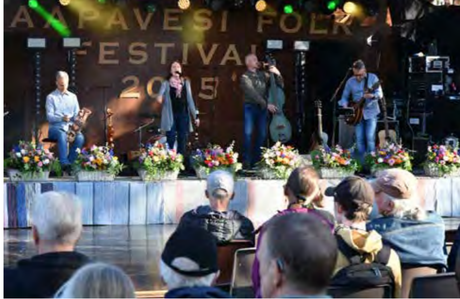
Freija-yhtye esiintymässä Folkeilla kesällä 2025. Vuonna 2005 perustettu yhtye tunnetaan lauluvetoisesta ilmaisustaan ja raikkaista tulkinnoistaan suomalaisesta kansanmusiikista.

FOLK-VIIKKO on koko kaupungin yhteinen ponnistus. Festivaalin tekemiseen osallistuu laaja joukko haapavetisiä vapaaehtoisia, yhdistyksiä ja yrityksiä – kaupungin pitkäjänteistä tukea unohtamatta. Ilman tätä yhteisöä Haapavesi Folkia ei olisi olemassa – festivaali on aidosti yhteinen teko, josta