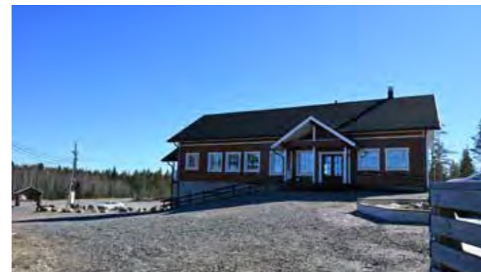
Aakonmajan yläkerroksesta löytyy keittiö sekä pääsali ja alakerrasta wc-tilat, pukuhuoneet sekä sauna.

Aakonvuoren alue palvelee kaikenikäisiä käyttäjiä ja eri tasoisia liikkujia.