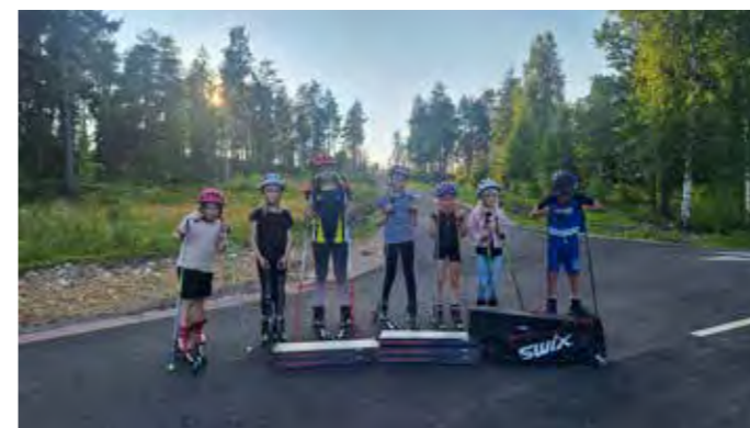
Aakonvuoren alueella hiihdetään lähes ympäri vuoden. Talvella ladulla ja kesällä rullahiihtoradalla.