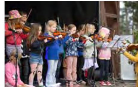
Lastenpäivänä lavalle nousevat aina nuoret muusikot. Tässä taidonnäytettä vuoden 2023 festivaalilta.

OHJELMISTOSSA musiikin rinnalla kulkee kulttuuriperinnön aktiivinen rakenta-