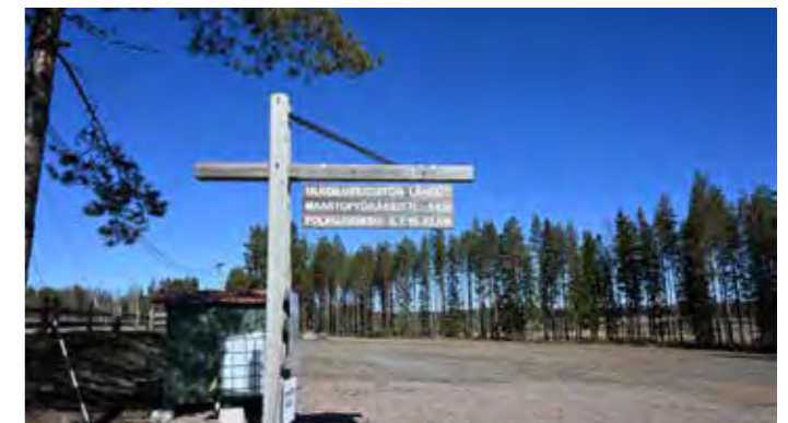
Hyvin merkityt reitit johdattavat ulkoilijoita vaihtelevassa maastossa.