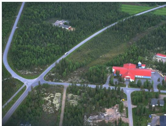
Kuva 13: Pulkkilantien varsi Rokulinmäellä.