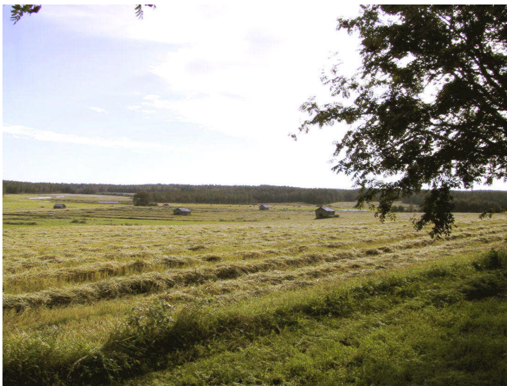
Kuva 2: Näkymä Sulkakylän länsipuolelle avautuvaan peltolaaksoon. Taustalla metsäinen rinne rajaa avointa laaksoaluetta.

Pohjois-Pohjanmaan liitto on inventoinut Mustikkamäen – Sulkakylän viljelysaukean maakunnallisesti arvokkaaksi maisema-alueeksi.