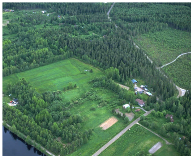
Kuva 12: Partaperää Haapakosken lähellä.