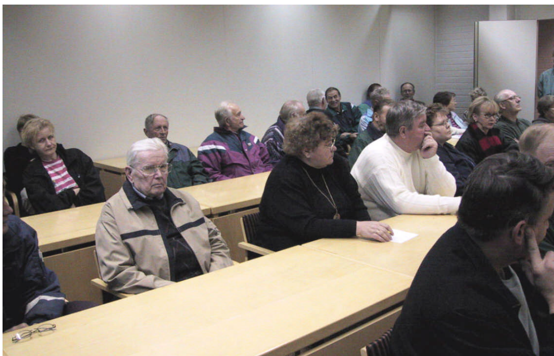
Kuva 6: 25.10.2000 pidetyn yleisötilaisuuden osanottajia.

Humalojan koulun toivotaan säilyvän. Sinne tarvitaan enemmän oppilaita. Haapavesi tulisi tehdä hyväksi eläkeläisille.