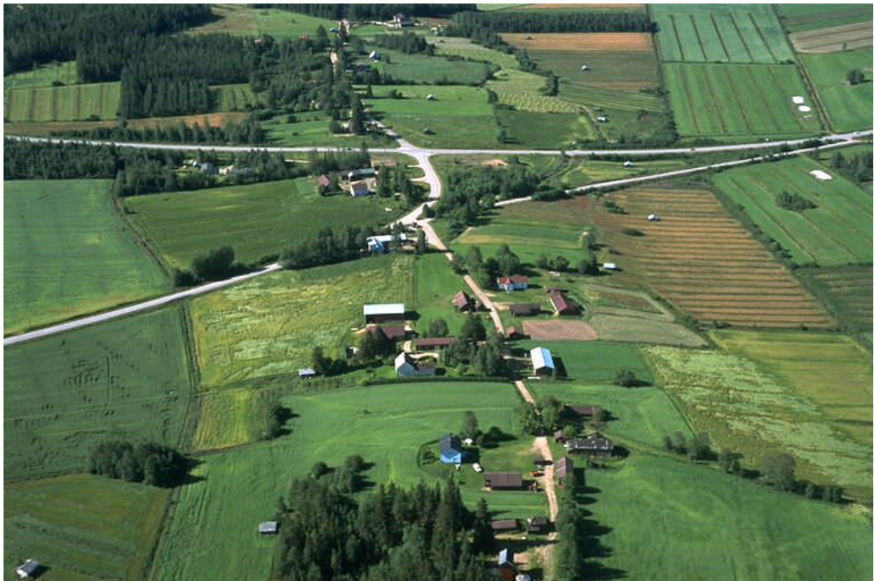
Kuva 3: Sulkakylää kaakosta päin kuvattuna.

Haapaveden kulttuuriympäristössä on säilynyt verraten paljon kulttuurihistoriallisesti merkittäviä kohteita. Osa kohteista muodostaa selviä kokonaisuuksia, joita erityisesti tulisi varjella tulevienkin polvien kulttuuriperinnöksi ja historiantajun tukemiseksi. Näitä kokonaisuuksia ovat Vanhantien varren säilyneet raittiosuudet ja nk. 0-alue sekä viljelysaukeiden keskelle kumpareille syntyneet rakennusryhmät Mustikkamäellä ja Sulkakylällä. Huonokuntoisiakin kohteita näillä alueilla on syytä säilyttää korjaustoimenpiteitä varten. Kaupungin ja yleishyödyllisten yhdistysten esim. Haapavesiseuran toimesta voidaan pohtia tapoja arvokkaiden yksittäiskohteiden ja laajempien aluekokonaisuuksien kunnostamiseksi ja kunnossa pitämiseksi. Alueet tulee rajata yleiskaavassa ja niille tulee laatia ohjeet hoidolle ja ylläpidolle, joita voidaan tarkentaa asemakaava-asteella ja ympäristöä rakennettaessa.