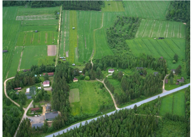
Kuva 10: Morkonperän kumpareelle syntynyt rakennusryhmä.