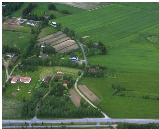
Kuva 16: Töttörönperäntien varren asutusta.