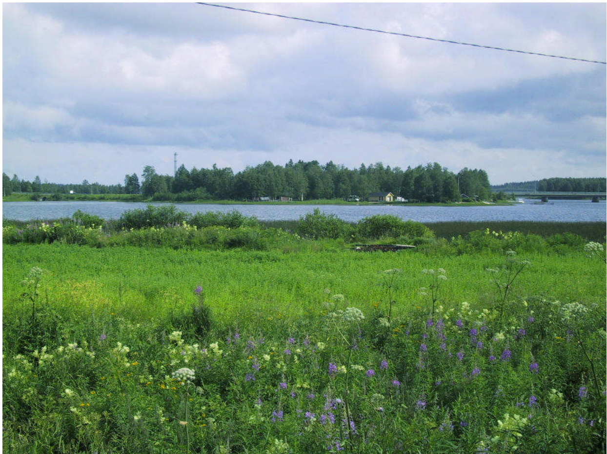
Kuva 4: Kylpyläsaaren länsilaita Herralanniemestä kuvattuna.

Tieverkkoon ei ole tulossa vähäistä suurempia muutoksia. Kevyen liikenteen ja ulkoilun reittitar- peet tulee käydä läpi. Kevyelle liikenteelle on tarve osoittaa uusia reittejä taajamaan johtavien väylien varsille. Erityistä huomiota ulkoilureittejä suunniteltaessa tulisi kiinnittää Haapajärven ympäri kulkevan ulkoilureitin linjauksen miettimiseen. Reitti halutaan yleisön käyttöön, mutta maanomistajien vastustus on voimakasta.