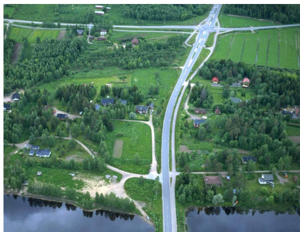
Kuva 8: Huiskan alue.