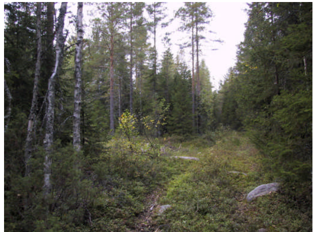
Kuva 11: Myllyöjan kangasta.