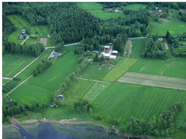
Kuva 7: Eskolanniemen asutusta.