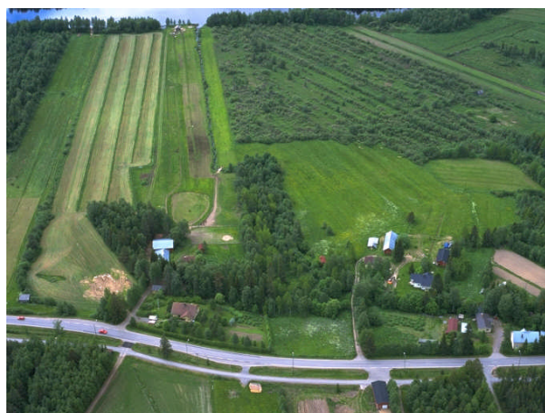
Kuva 9: Humalojan rantapeltoja.