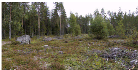
Kuva 14: Ryyppymäen lakea.