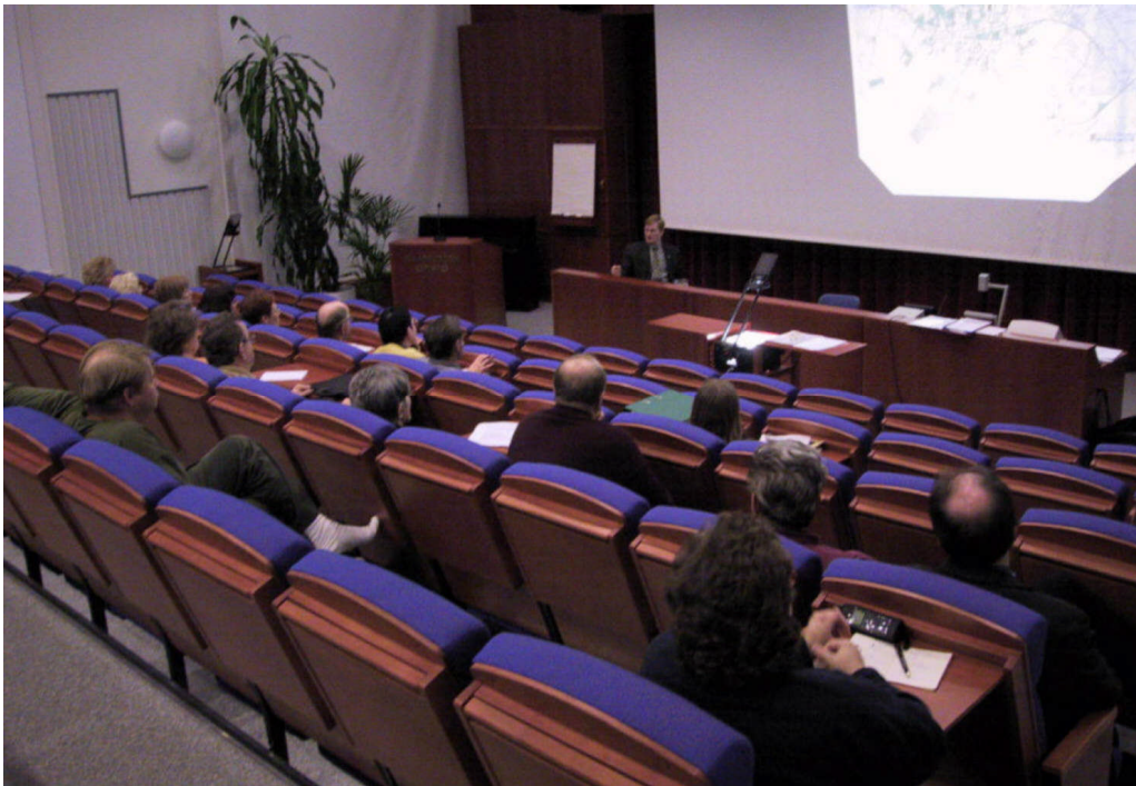
Kuva 5: Tavoiteseminaarin osallistujia keskustelemassa maankäytön tavoitteista.

Elinkeinon kehittämisen sisältö pohjaa paikallisiin voimavaroihin sekä puunjalostus-, metalli- ja informaatioteknologiasektoreihin. Matkailupalveluita, palveluita ja maatalouden jatkojalostusta tulisi kehittää. Halutaan monipuolisia ja koulutusta vastaavia työpaikkoja eri kokoisten yritysten ja osuuskuntatoiminnan kautta.