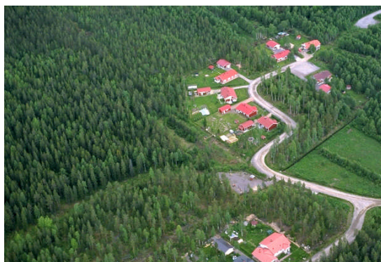
Kuva 15: Uusinta asuinalueita Sikokallion vieressä Raatesuolla.