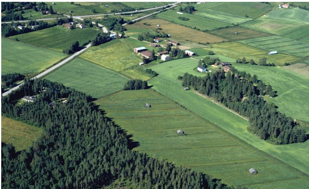
Kuva 17: Sulkakylän koillispuolella maaseutumaisesta ympäristöstä.

Asukaskyselyyn liitettiin kysymys, johon asukkaat voivat esittää oman näkemyksensä laajentumisalueiden paremmuusjärjestyksestä. Suosituimmat alueet asumiseen ovat aluevertailun vastanneiden mukaan Eskolanniemi, Huiska, Humaloja ja Töttörönperä. Aluevertailun ulkopuoliksi uusiksi asumisen alueiksi ehdotettiin Sulkakylää ja muita sivukylä. Yhtäläistä näille alueille on väljä ja maaseutumainen rakenne. Kaikkein vähiten muuttohalukkuutta oli aluevertailun vastanneiden mukaan Sikokalliolle ja Rokulinmäelle, jotka ovat metsän keskellä ja liittyvät tuoreimpiin asemakaavoitettuihin asuinalueisiin.